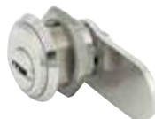
Замки для обладнання

Додай до високобезпечного циліндра якісний замок і захисну фурнітуру та отримай Комплексне рішення безпеки для вхідних дверей.