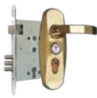
Замки основні та фурнітура