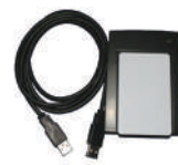
Програмактор безконтактних карток JWM