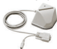
Програмактор безконтактних карток ADEL