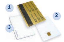
Електронні картки 1. Магнітна картка 2. IC картка 3. Безконтактна проксимітні картка

Готельні системи ADEL в Україні встановлені та надійно функціонують у готелях: